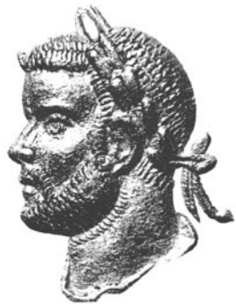
Archäologischer Park Kellmünz