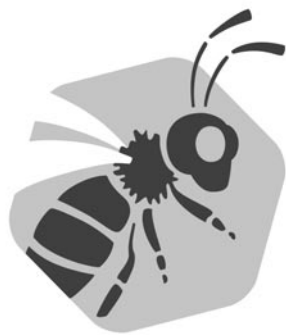
Bayerisches Bienenmuseum Illertissen